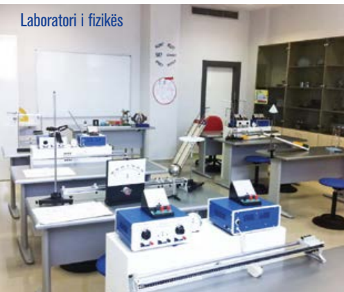
Laboratori i fizikës