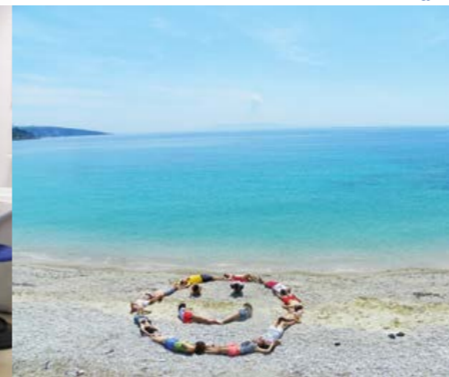
Ekskursion i gjimnazit me tenda kampingu në plazhin e Livadhit. Në program: lojëra, barbeky, vizitë kulturore.