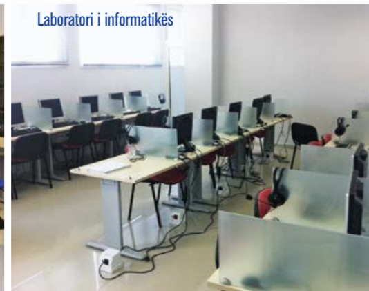
Laboratori i informatikës