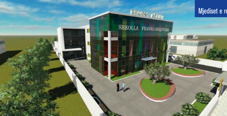
Mjediset e reja të shkollës