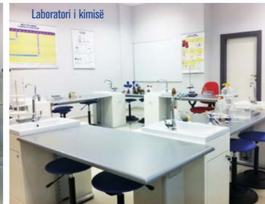
Laboratori i kimisë